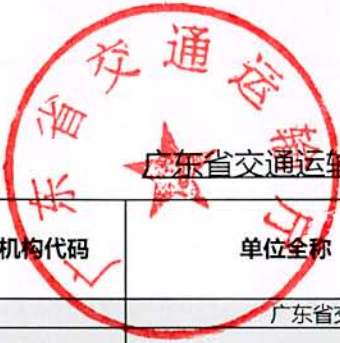
广东省交通运输厅(部门)2018年度行政许可实施情况统计表(盖章)