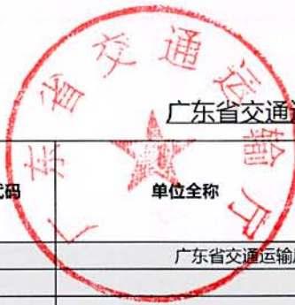
广东省交通运输厅(部门)2018年度行政处罚实施情况统计表(盖章)